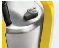
Rápido ajuste entre modo manual o automático