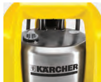
Robusta carcasa de acero inoxidable