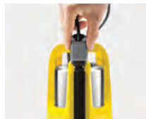
Sensor de nivel del agua