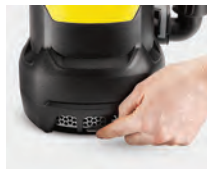
El pre filtro integrado protege de la suciedad más gruesa