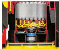
Retén frontal cerámico