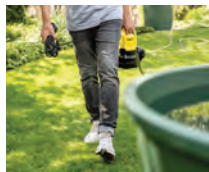
Cómoda asa de transporte