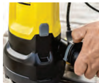
Conexiones optimizadas sin necesidad de herramientas