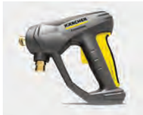
Pistola EASY!Force Food