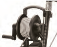
Incluye enrollador de manguera de 15 m