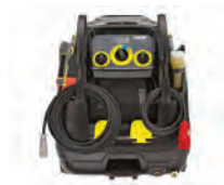
Uso fácil e intuitivo