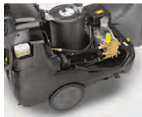
Tecnología del quemador altamente eficaz