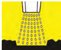
Aumenta un 40% la presión de impacto