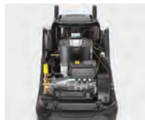
Electromotor de cuatro polos con bomba axial de tres pistones