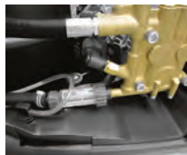
Sistema de amortiguación de vibraciones SDS